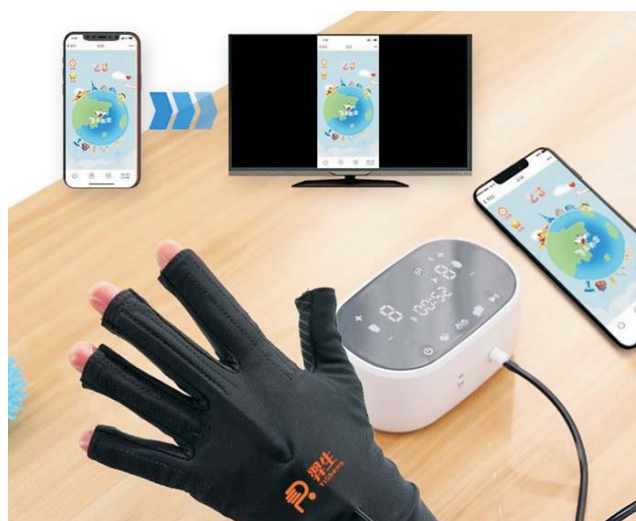
Imagenes de distintos ejercicios con el guante de activación: