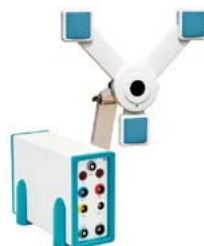
Modulo analisis 3D en tiempo real