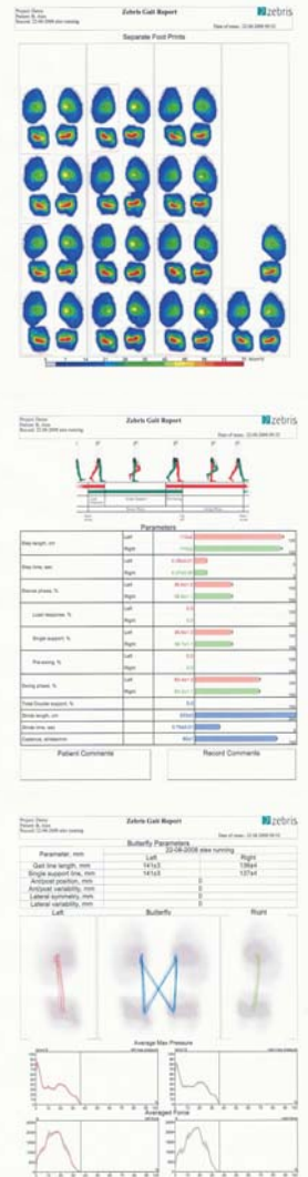
Ejemplo informe final de una prueba