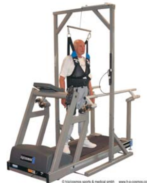
andando de lado