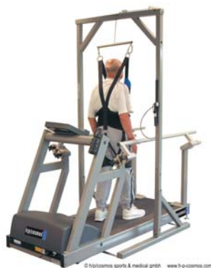
andando de espalda