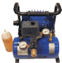
Compresor para modelos 70 y 160