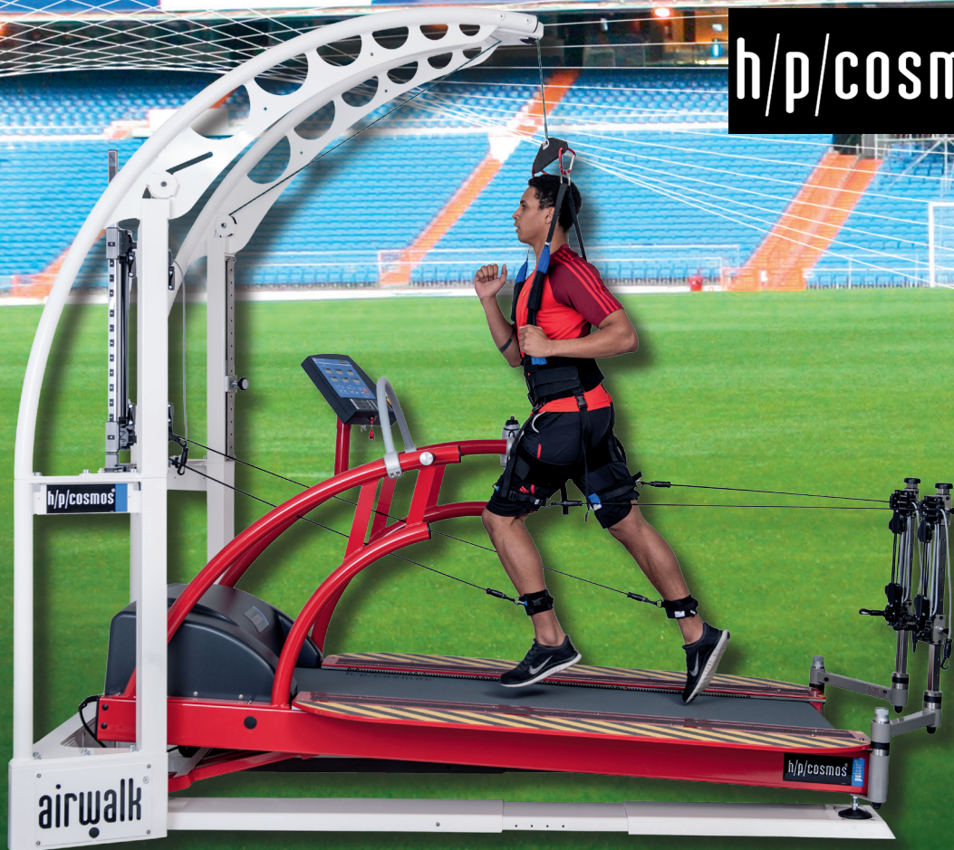
Cinta rodante pulsar® 3p con airwalk® ap y robowalk® expander