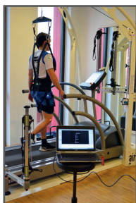
Análisis del movimiento

El robowalk® expander es un sistema de corrección de la marcha que se puede añadir a su cinta de correr h/p/cosmos !! El sistema tiene un precio muy atractivo y es asequible también para pequeños centros de Fisioterapia y Centros de Rehabilitación.