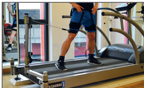
fuerza lateral con robowalk® expander