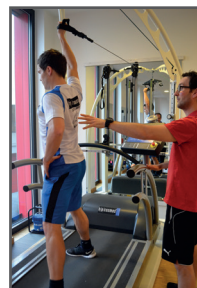
entrenamiento de la cadena medial